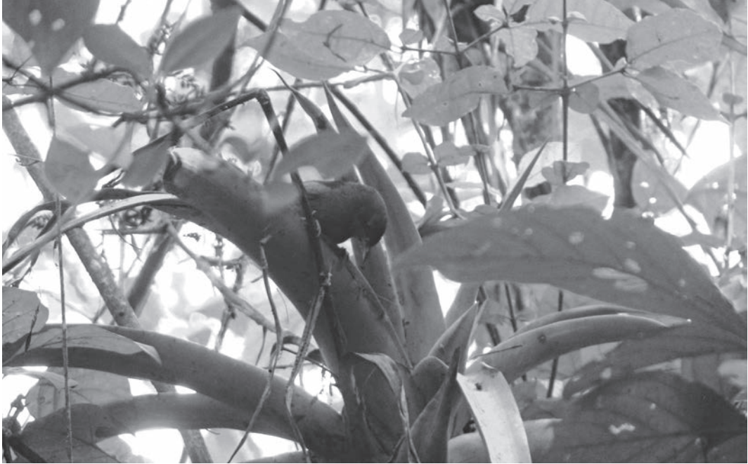
Figura 2. Un individuo adulto de Synallaxis tithys forrajeando en la localidad de Huabal, Canchaque, Piura, Perú, 7 marzo 2010

personal de LSUMZ y CORBIDI colectaron seis individuos, preparando cinco pieles y un esqueleto.