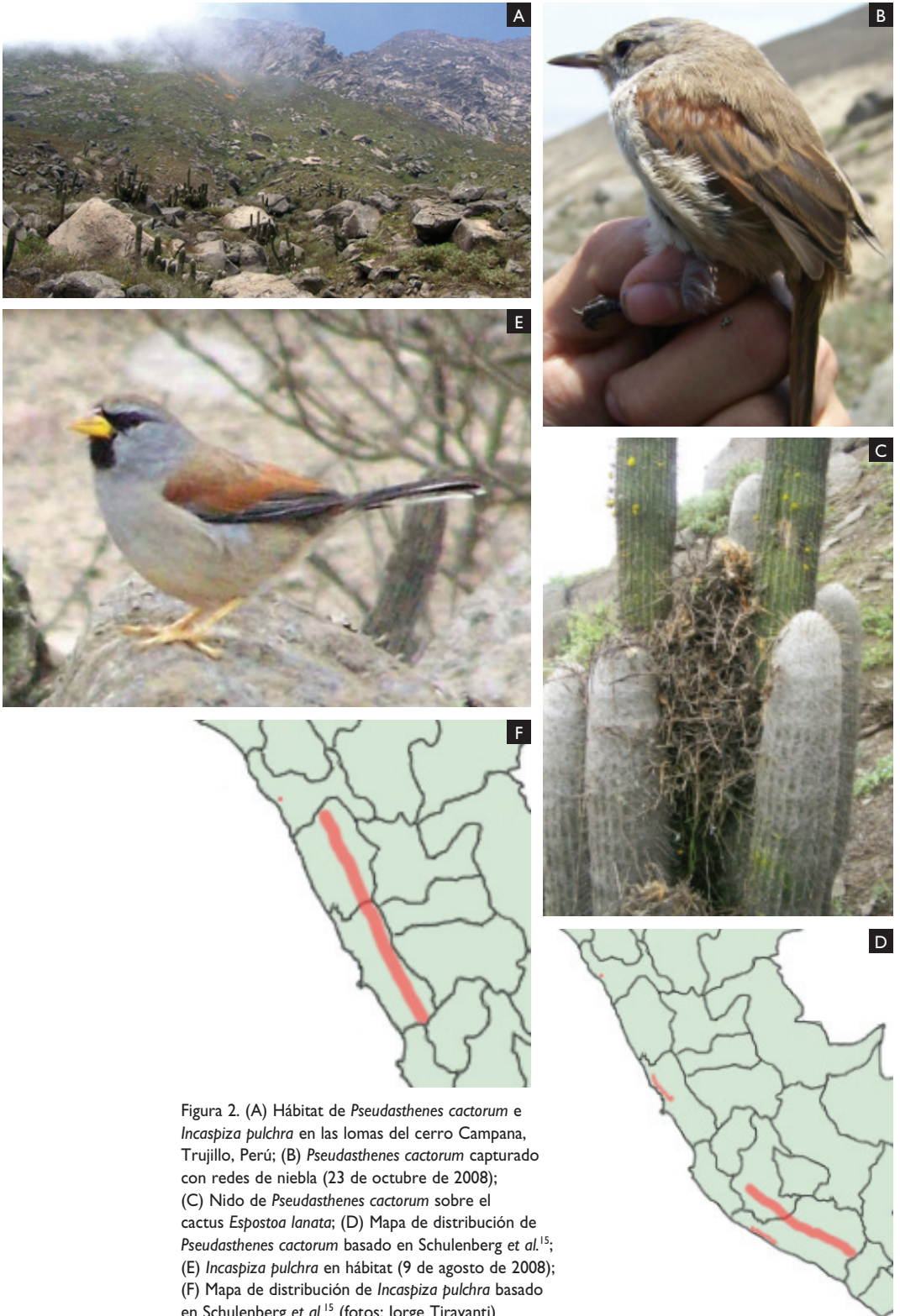
Figura 2. (A) Hábitat de Pseudasthenes cactorum e Incaspiza pulchra en las lomas del cerro Campana, Trujillo, Perú; (B) Pseudasthenes cactorum capturado con redes de niebla (23 de octubre de 2008); (C) Nido de Pseudasthenes cactorum sobre el cactus Espostoa lanata ; (D) Mapa de distribución de Pseudasthenes cactorum basado en Schulenberg et al. 15 ; (E) Incaspiza pulchra en hábitat (9 de agosto de 2008); (F) Mapa de distribución de Incaspiza pulchra basado en Schulenberg et al. 15