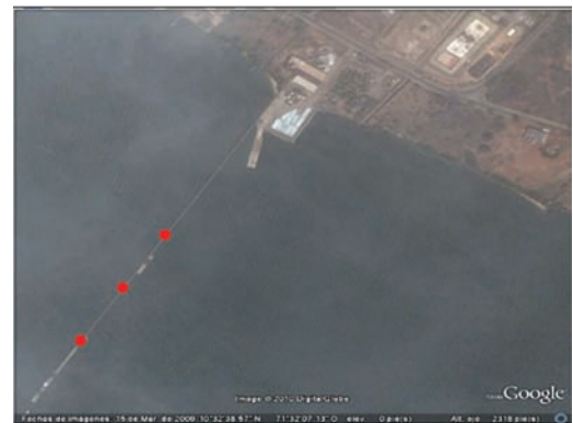
Figura 2. Sitios de avistamiento de Petrochelidon fulva a lo largo del cableado del muelle de la empresa Pralca, municipio Santa Rita, Zulia, Venezuela.

Identificación. —A pesar que P. pyrrhonota ( P. p. pyrrhonota y melanogaster ) pueden tener la frente color canela 1,6 en general la tienen de color ante o rufo blanquecino 6 a diferencia de P. fulva que presenta la frente de color rojo ladrillo. Aunado a lo anterior, P. fulva presenta la coloración ante o rufo en la parte superior del pecho y flancos más marcada y extendida que P. pyrrhonota 1 (Figs. 3–4). La cola ligeramente ahorquillada de P. fulva (Fig. 5) la diferencia de P. pyrrhonota que la presenta cuadrada 6 . La taxonomía para varias poblaciones de Golondrina de las Cavernas ha cambiado en los últimos años, sugiriendo la necesidad de estudios adicionales 2 . Restall et al. 6 señala dos subespecies, P. f. pallida y P. f. cavicola , diferenciadas en que ésta última es más pequeña con una corona azul intenso, mejillas y garganta rufas y rabadilla