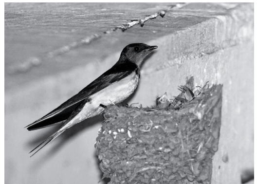
Figura 2. Individuo adulto alimentando los pichones fotografiado en uno de los nidos