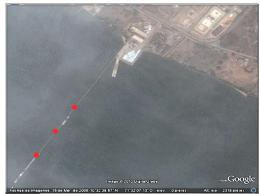
Figura 2. Sitios de avistamiento de Petrochelidon fulva a lo largo del cableado del muelle de la empresa Pralca, municipio Santa Rita, Zulia, Venezuela.

Identificación. —A pesar que P. pyrrhonota ( P. p. pyrrhonota y melanogaster ) pueden tener la frente color canela 1,6 en general la tienen de color ante o rufo blanquecino 6 a diferencia de P. fulva que presenta la frente de color rojo ladrillo. Aunado a lo anterior, P. fulva presenta la coloración ante o rufo en la parte superior del pecho y flancos más marcada y extendida que P. pyrrhonota 1 (Figs. 3–4). La cola ligeramente ahorquillada de P. fulva (Fig. 5) la diferencia de P. pyrrhonota que la presenta cuadrada 6 . La taxonomía para varias poblaciones de Golondrina de las Cavernas ha cambiado en los últimos años, sugiriendo la necesidad de estudios adicionales 2 . Restall et al. 6 señala dos subespecies, P. f. pallida y P. f. cavicola , diferenciadas en que ésta última es más pequeña con una corona azul intenso, mejillas y garganta rufas y rabadilla