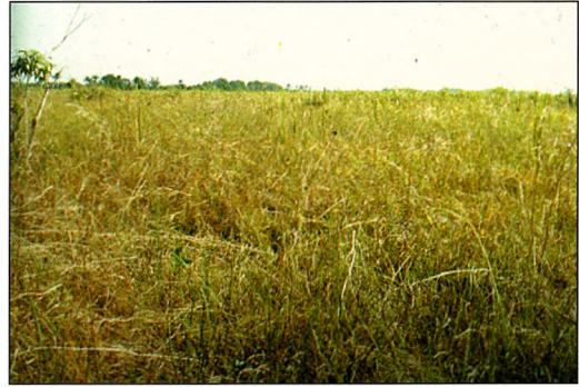
Figura 3-4. Hábitat de Gallinuela de Santo Tomás; Peralta (izquierda) y Hato de Jicarita (derecha)