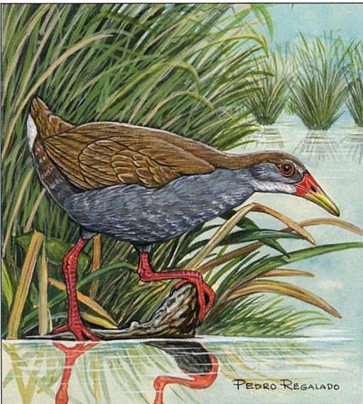
Gallinuela de Santo Tomás Cyanolimnas cerverai (Pedro Regalado Ruiz)

En estas áreas de cortadera, se encontró a la Gallinuela con más regularidad, lo cual hizo imposible su localización visual y captura. Igualmente, varias de las aves encontradas fueron en áreas donde la vegetación no alcanzaba 30 cm de altura. De igual manera, se logró encontrar varios territorios de distintas parejas, aunque el tamaño de los mismos no pudo ser determinado.