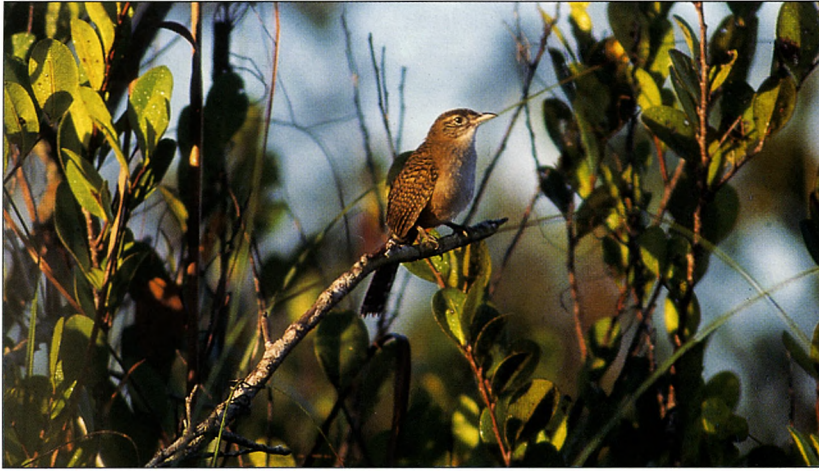
Figura 2. Ferminia Ferminia cerverai (Jon Hornbuckle)