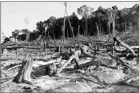
Al sur de casa Enramadita, Parque Nacional Caaguazú (Alberto Madroño N.)