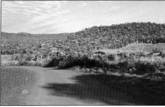
Camino a pto. Enramadita desde Cristal, Parque Nacional Caaguazú (Alberto Madroño N.)

Asimismo, nuestros datos añaden 39 especies no registradas durante los trabajos de Lowen et al. 13 en el sector oriental. Con los resultados de los autores mencionados y el presente trabajo, la lista de aves del parque alcanza 250 especies, cifra que probablemente aumentará cuando se realice una compilación que incluya todas las observaciones y registros realizados por guardaparques y otros visitantes. De los 76 endemismos del Bosque Atlántico 17 citados en Paraguay 13 , 63 (83%) se han registrado en el PNC (Lowen et al. 13 y este trabajo), aspecto que demuestra la contribución del PNC en la conservación de aves del Bosque Atlántico. Entre los registros de Lowen et al. 13 en el PNC, figuran algunas especies endémicas de gran interés con cierta preferencia de bambú 17 tales como: Drymophila rubricollis , Clibanornis dendrocolaptoides , Amaurospiza moesta y Sporophila falcirostris . Ninguna de las mismas fueron detectadas en nuestro trabajo. Esto puede deberse a la escasez de bambuzales en el sotobosque y en los bordes (crecimiento secundario) del área de estudio. Se debe resaltar que aunque el estado de conservación del bloque oriental es notablemente inferior al occidental, la presencia de abundantes bambuzales en el primero le confiere una gran importancia para la conservación de aves endémicas con cierta asociación a áreas con predominio de bambuzal.