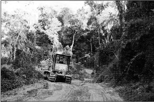
Bosque desprotegido en la zona baja al sur de casa Enramadita, Parque Nacional Caaguazú (Alberto Madroño N.)